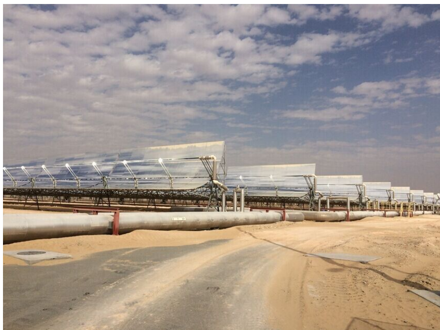
图:Shams1 电站槽式集热镜场