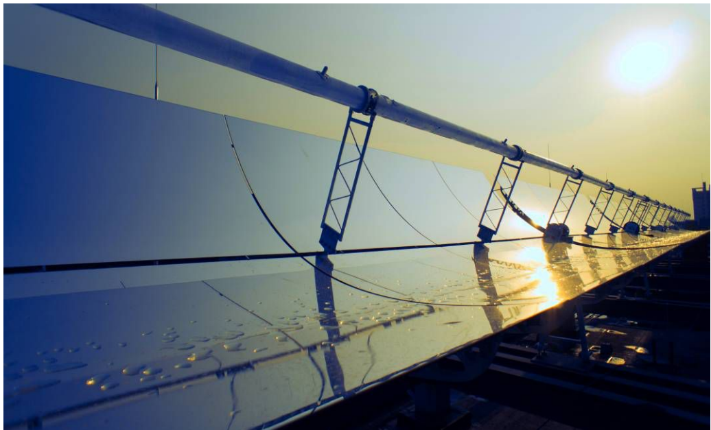
一等奖：雨后复斜阳（作者：黄炜）