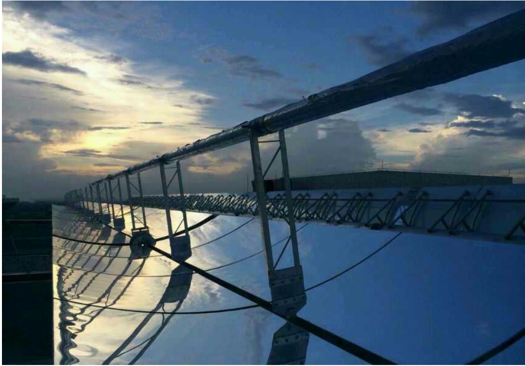
一等奖：光影（作者：原郭丰）