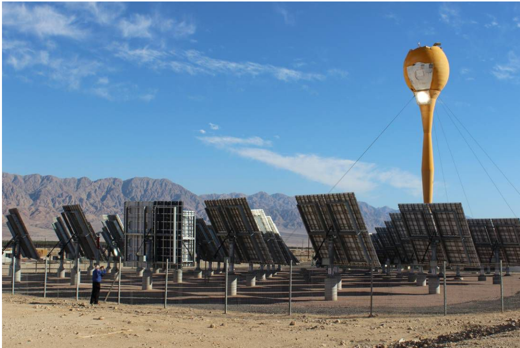
二等奖：光热发电系统调试（作者：季良俊）